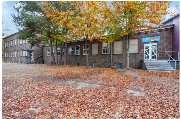
Gebäudeansicht von der Seite